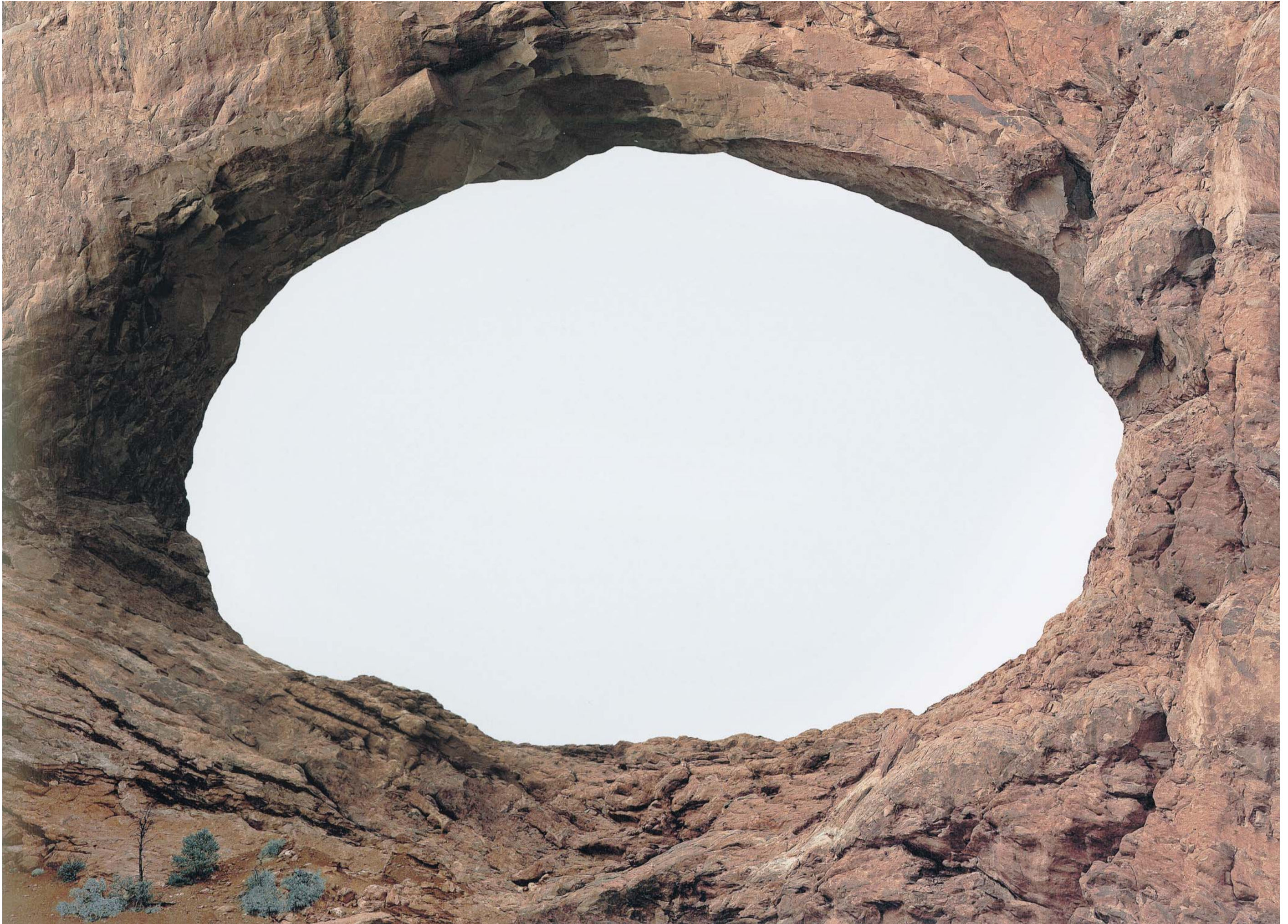
Partition Arch, Windows Arch, North Window? Die Launen der Natur schufen in Utah eine kaum überschaubare Zahl eigentümlicher Felsformationen. Perfektion aber schafft erst der Künstler am Computer.